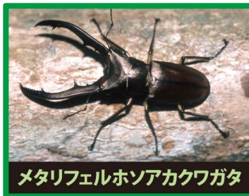
メタリフェルホンアカクワガタ

野外に出ると、日本のカブトムシやクワガタの餌やすみかをうばったり、交雑したり、昆虫の病気を広めたりします。