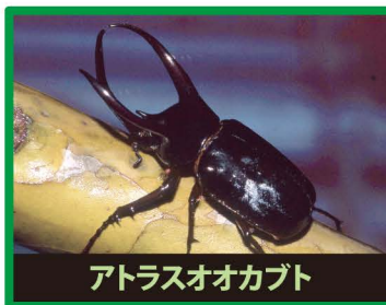
アトラスオオカブト