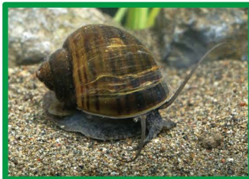
スクミリンゴガイ