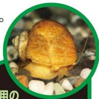
かんしょう用の ゴールデンアップルスネール

つかまえても、他の場所に持って行かないでね。飼っている貝は、池や川に放さないでね。